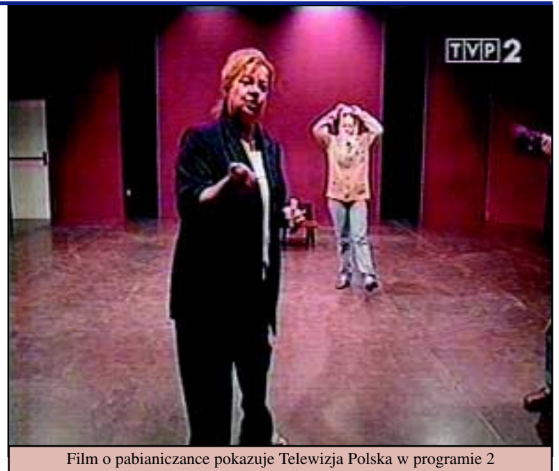
Film o pabianiczance pokazuje Telewizja Polska w programie 2

Słowiańska uroda Żywili urzekła hiszpańskich reżyserów. Grała w sztuce teatralnej „Przy drzwiach zamkniętych” i „Opowieści terrorysty”. Potem