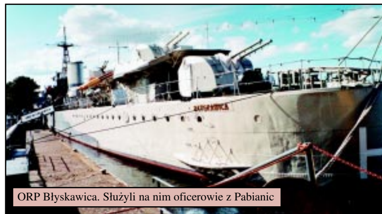
ORP Błyskawica. Służyli na nim oficerowie z Pabianic