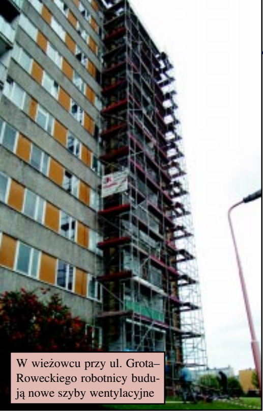
W wieżowcu przy ul. Grot-Roweckiego robotnicy budują nowe szyby wentylacyjne