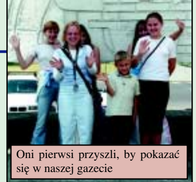
Oni pierwsi przyszli, by pokazać się w naszej gazecie

Kolczyki były znane już w starożytności, jednak tylko najbogatsi nosili wtedy ozdoby ze złota lub srebra. Były one oznaką przynależności do wyższej klasy społecznej. Natomiast najubożsi zdobili ciało kolczykami z miedzianego drutu, kości i piór.