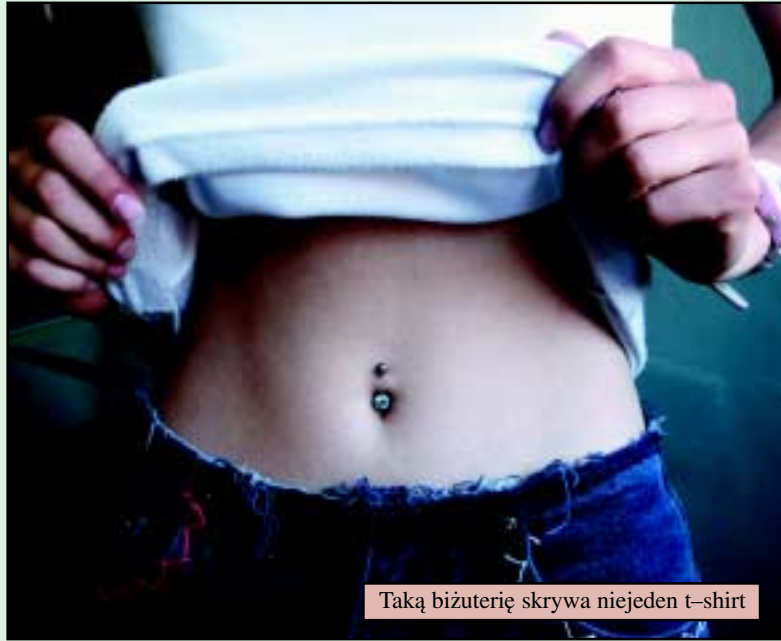
Taką biżuterię skrywa niejedyn t-shirt

Kolczyki były znane już w starożytności, jednak tylko najbogatsi nosili wtedy ozdoby ze złota lub srebra. Były one oznaką przynależności do wyższej klasy społecznej. Natomiast najubożsi zdobili ciało kolczykami z miedzianego drutu, kości i piór.